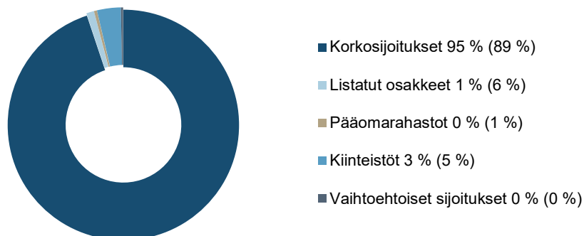
Kuva 1: Vakuutuskannan sijoitusallokaatio 31.12.2023. Suluissa vuoden 2022 vertailuluvut.